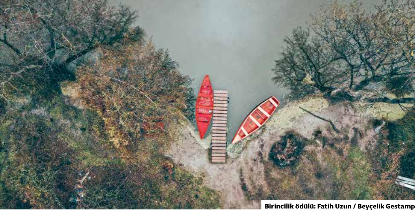
Birincilik ödülü: Fatih Uzun / Beyçelik Gestamp