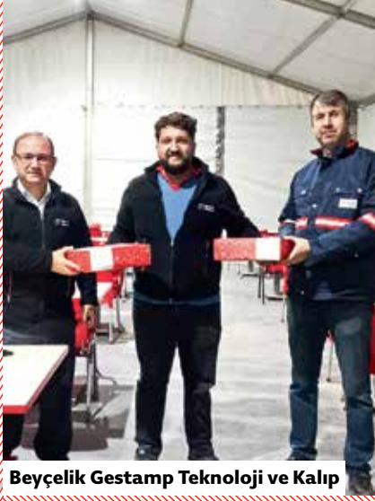
Beyçelik Gestamp Teknoloji ve Kalıp

Beyçelik Gestamp İnsan Kaynakları ekipleri yeni yıl için çalışanlara özel hazırlanan paketlerin teslimini yaparak, yeni yıl için dilek ve temennilerini paylaştı.