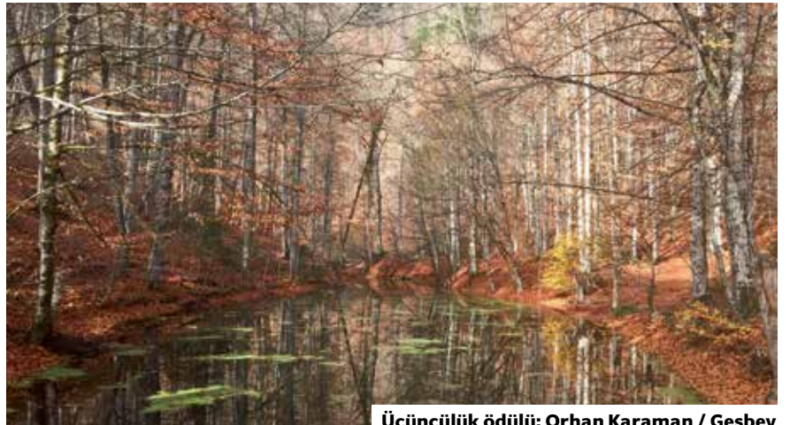
Üçüncülük ödülü: Orhan Karaman / Gesbey