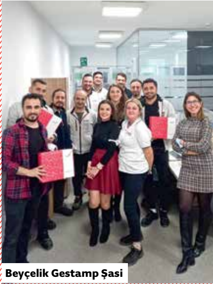
Beyçelik Gestamp Şasi