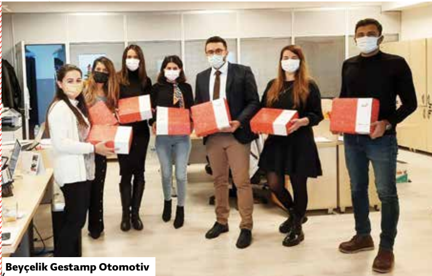
Beyçelik Gestamp Otomotiv