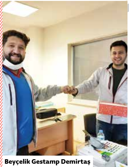
Beyçelik Gestamp Demirtaş