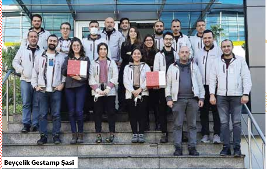
Beyçelik Gestamp Şasi