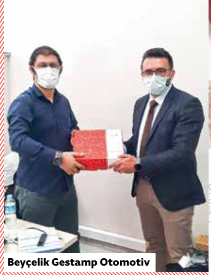
Beyçelik Gestamp Otomotiv